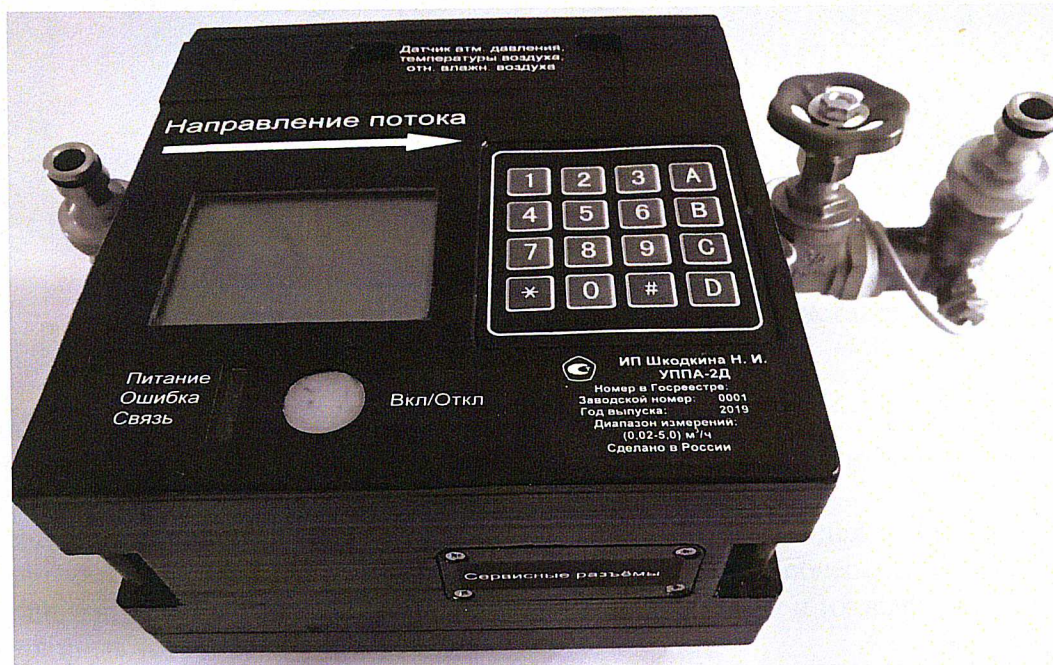
Рисунок 2 – Общий вид установок модификации УППА-2-Д и УППА-3-Д

Пломбирование установок осуществляется с помощью 2 (двух) свинцовых пломб (с нанесением знака поверки на пломбу) и проволоки, которыми пломбируются корпус с первичным преобразователем расхода и измерительно-вычислительным комплексом, а так же фиксатор, блокирующий доступ к датчику температуры, атмосферного давления и относительной влажности окружающей среды.