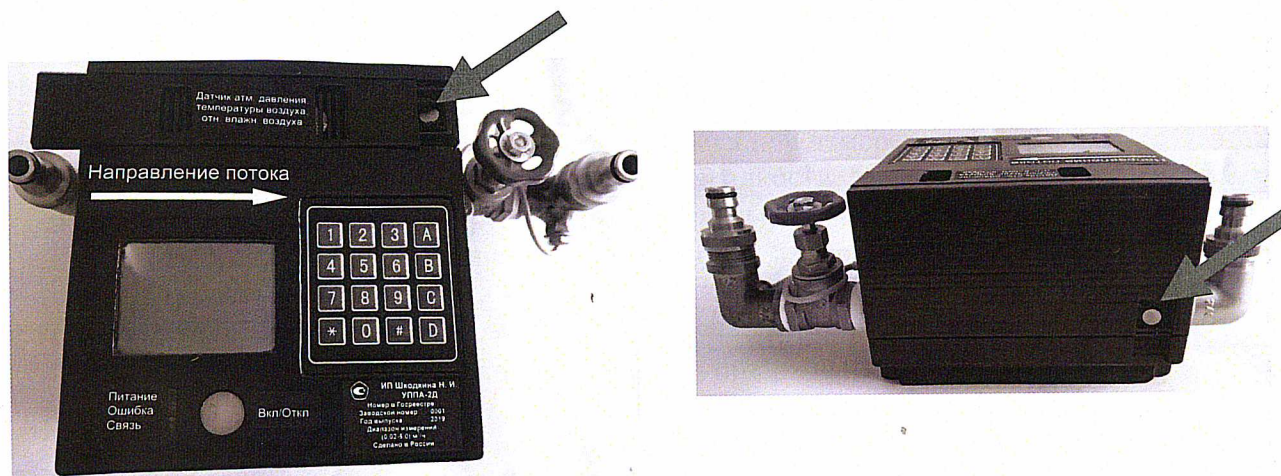
Рисунок 4 – Места нанесения знака поверки на установки модификации УППА-2-Д и УППА-3-Д