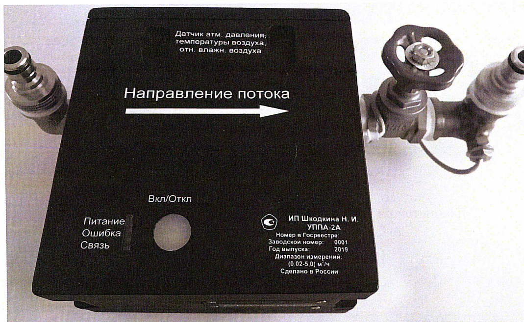
Рисунок 1 – Общий вид установок модификации УППА-2-А и УППА-3-А

Общий вид установок представлен на рисунках 1, 2.